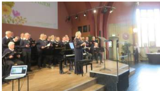
28 maart 2026 Dag van de Amateurkunst