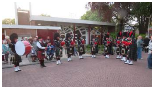
4 mei 2026 Dodenherdenking