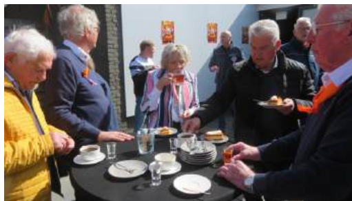
27 april 2026 Koningsdag