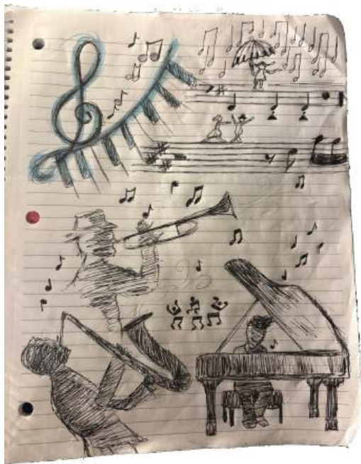
Altijd aantekeningen maken

Maar je mag ook een verzoeknummer indienen. Jasper was jarig geweest, had getrakteerd, dus hij voldeed aan alle voorwaarden om ook een verzoeknummer te laten zingen. Het werd 189; Only Remembered en dat werd met genoegen gezongen. Daarmee kwam een intensief avondje zingen weer ten einde.