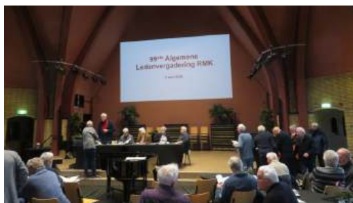
2 april 2026 Algemene Ledenvergadering