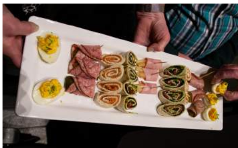
De hapjes vonden gretig aftrek

vonden gretig aftrek. Zonder te zingen werd de gezellige receptie beëindigd en de aftocht aanvaard. Klaar voor de eerste repetitie op 11 januari.